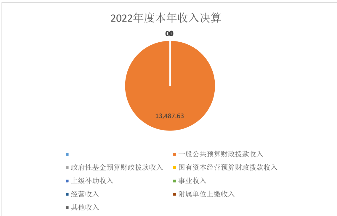
图 1. 收入决算图

本年上级补助收入 0.00 万元，占 0.00%； 本年事业收入 0.00 万元，占 0.00%； 本年经营收入 0.00 万元，占 0.00%； 本年附属单位上缴收入 0.00 万元，占 0.00%； 本年其他收入 0.00 万元，占 0.00%。